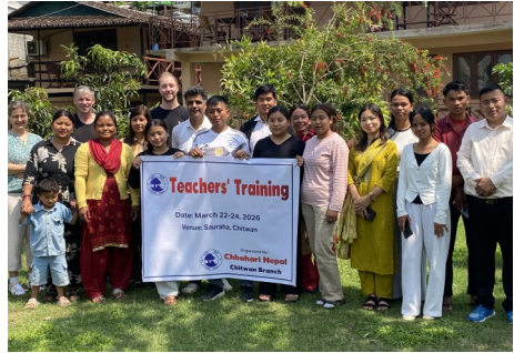
Teilnehmende des Teacher ´ Trainings

Nach all diesen Schulbesuchen waren wir auch noch beim „Teachers´ Training“