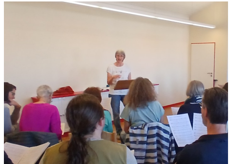
Familychor bei der Probe

Neue Sängerinnen und Sänger sind immer herzlich willkommen. Notenkenntnisse sind nicht erforderlich – die